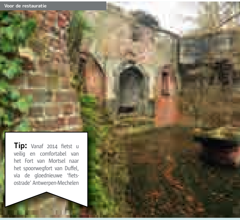
Voor de restauratie

Tip: Vanaf 2014 fietst u veilig en comfortabel van het Fort van Mortsel naar het spoorwegfort van Duffel, via de glorieieuze "fietsozide" Antwerpen-Mechelen