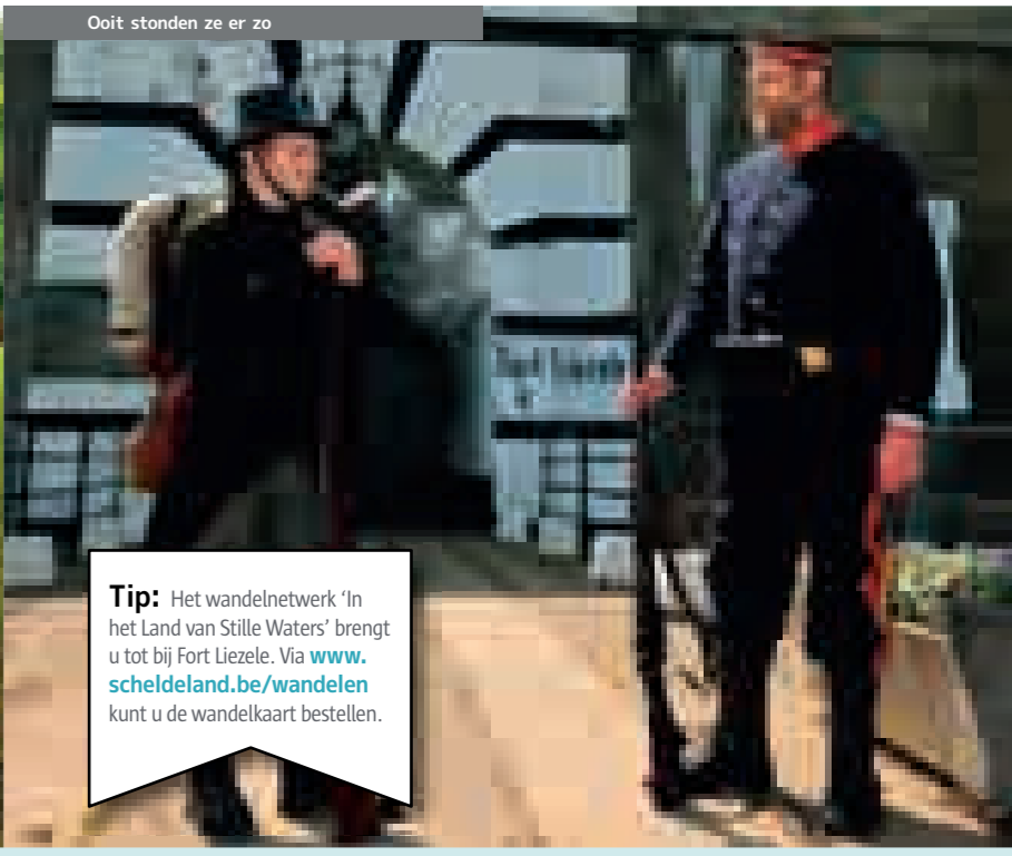
Ook stonden ze er zo

Tip: Wandel of fiets tussen Oelegem en Stabroek langs de groene Antikankracht. Vanaf 2012 wordt de spoorlinie verbreed en komen er picknickplaatsen.