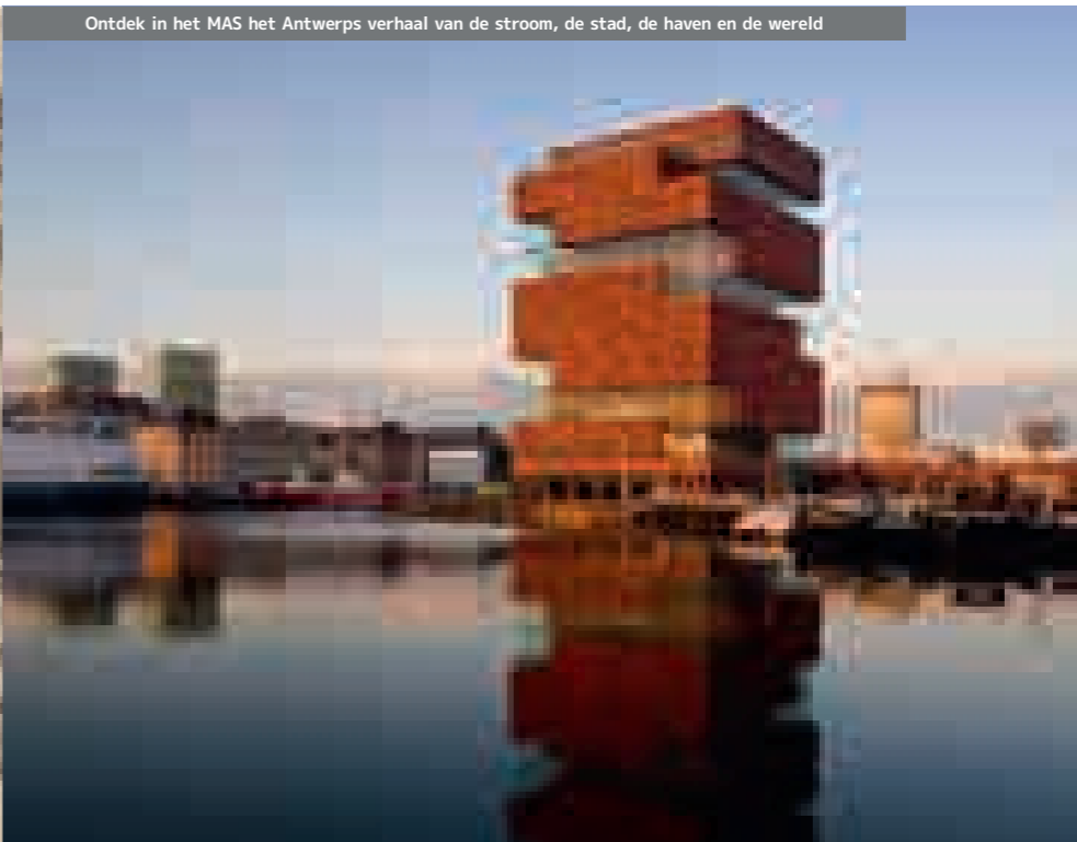
Ontdek in het MAS het Antwerps verhaal van de stroom, de stad, de haven en de wereld

De Staten gaven Antwerpen niet zo maar op. In de hoop de stad te heroveren bouwden ze nieuwe forten en schansen, en versterkte dijken in de Bergerweertpolder en bij Zandvliet. Maar bij de slag van Kalle in 1585 konden ze de Spaanse vloot niet de baas. Bij de Vrede van Münster werd de soevereiniteit over de forten rond Antwerpen vastgelegd. De Forten Liefkenshoek en Lillo bleven in Hollandse handen tot hun overdracht aan België in 1839. Kwam daarmee definitief een einde.