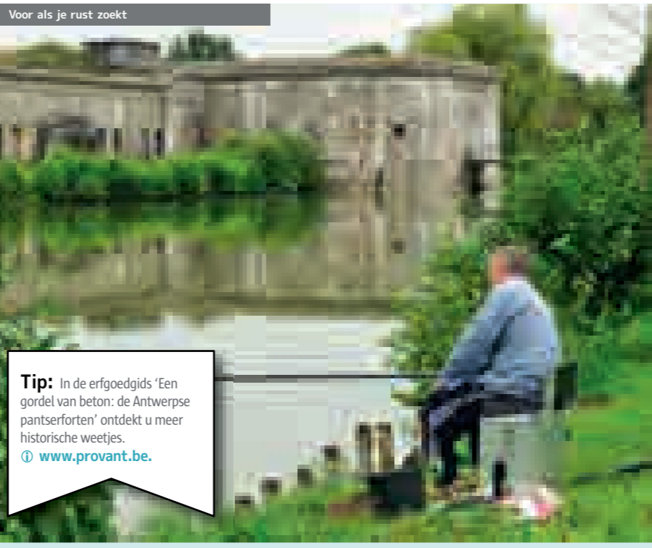
Voor als je rust zoekt

Tip: In de erfgoedjids 'Een gordel van beton: de Antwerpse pantserforten' ontdek je meer historische weetjes. www.provant.be .