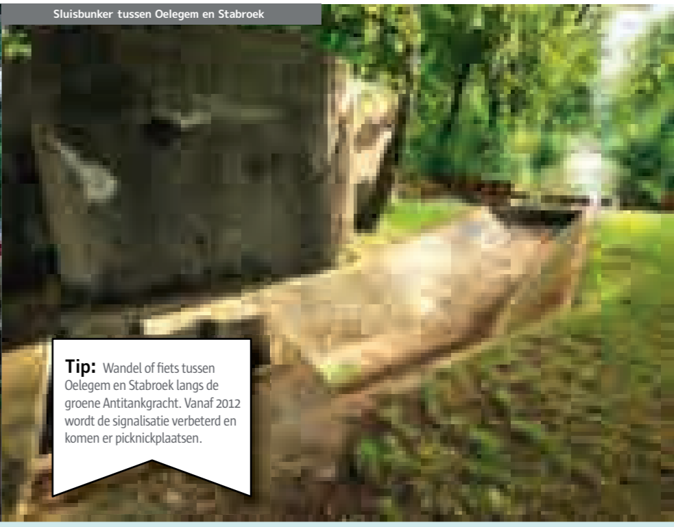
Sluiskובר tussen Oelegem en Stabroek

Tip: Noordtoeristen kunnen nu weer langs grote delen van de militaire spoorlijn stappen en omgeefde natuurplekjes ontdekken. Vergeet uw kaarten niet!