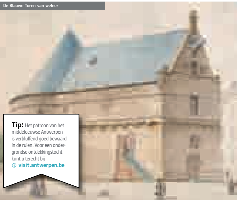
De Blauwe Toren van weleer

Alle sporen van de ooit zo indrukwekkende versterking zijn nu verdwenen. Maar aan het tracé van ruïen en vesten kunt u de concentrische groei van Antwerpen duidelijk aflezen. Ook namen als Suikerrui, Kaasruif of Meibrug en de velen namen op "vest" verwijzen nog naar het verleden. En vergeet ook het Blauwtorenplein nu. U ontdekt er de metersdikke muren van de gelijknamige toren die daar tot 1879 stond. Ze zijn nu als zitbanken opgenomen in het heraaengelegde park.