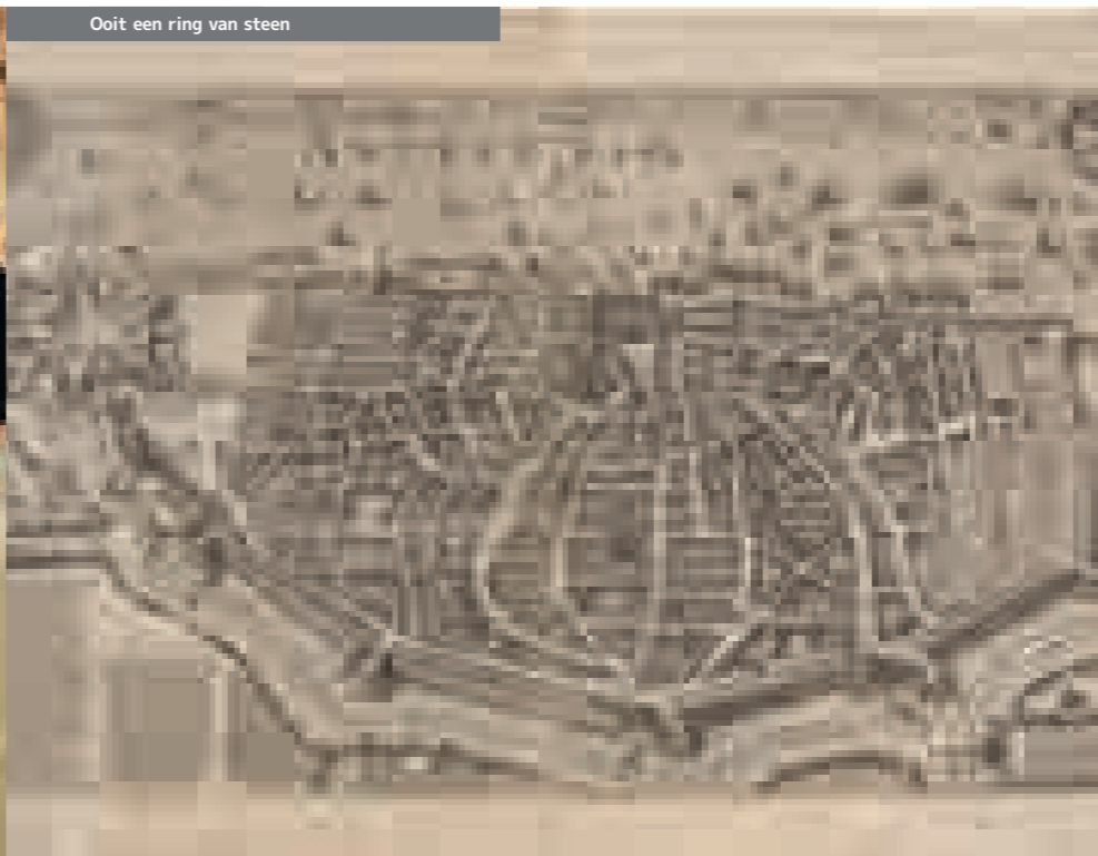
Ook een ring van steen

Tip: Info bastion: http://www.visit.antwerpen.be Ook het Stadspark - een ontwerp van de 19 de eeuwse landschap-architect Leijl - ligt op de plaats van het Lunet Herenbuis, en was een deel van de Spaanse omwalling.