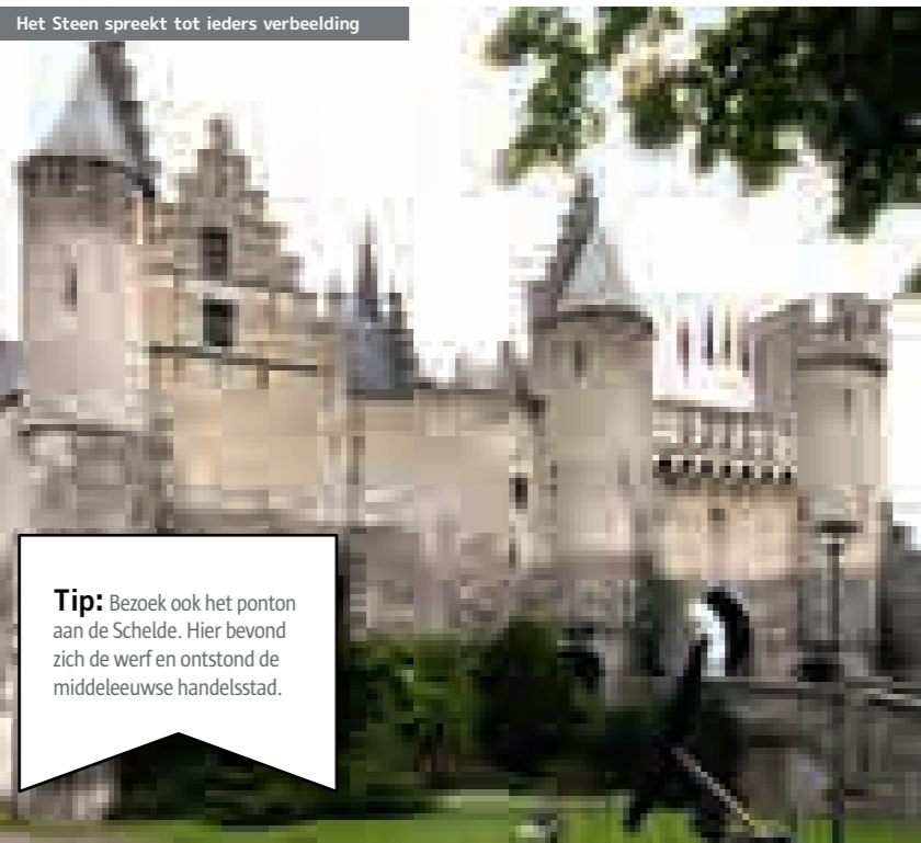
Het Steen spreekt tot ieders verbodding

Bij een wandeling in het historische centrum herinneren enkele relicten aan de verdwenen versterkingen: de restanten van de burchtmuur, het stratenpatroon (Burchtgracht, Zakstraat) en het Steen met de westelijke toegangspoort. De iets zuidelijke gelegen vlotsteiger is een knipooop naar de oude Werf waar alle Antwerpse handel ontstond.