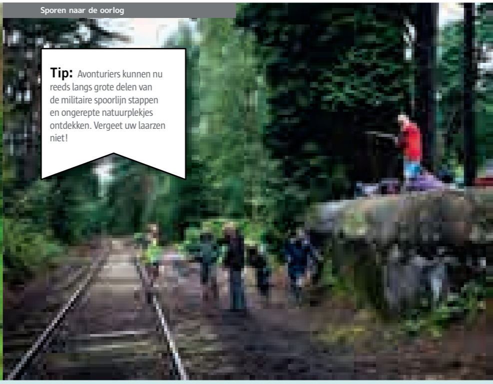
Sporen naar de oorlog

Tip: In de erfgoedjids 'Een gordel van beton: de Antwerpse pantserforten' ontdek je meer historische weetjes. www.provant.be .