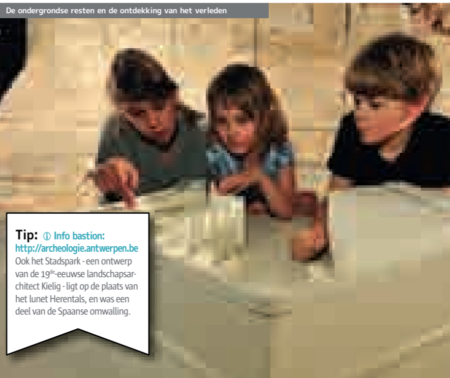
De ondergrondse resten en de ontdekking van het verleden

Eind 19 de eeuw werden de wallen afgebroken en vervangen door een nieuwe stadsboulevard, de leien. Bij de heraanleg daarvan in de jaren 2002-2005 legden archeologen de resten van het bastion Keizerspoort bloot. U kunt ze nu bewonderen in een speciaal aangelegde site van de ondergrondse parking Nationale Bank.